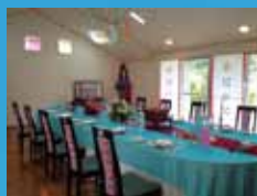
毎年恒例、南城市の「半島芸術祭」に参加。今回のテーマは「海〜ニライの彼方〜」。

「生活をともにし、学ぶ」という方針により生徒は十五人までとしている。定員になり次第終了なので学校見学は問い合わせから行う。