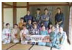
2011年7月12日 香港城市大学学生と お茶で交流会