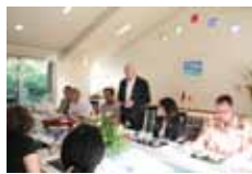
2011年7月15日 ドイツ大使のフォルカー・シウ ウタンツェル氏との交流会