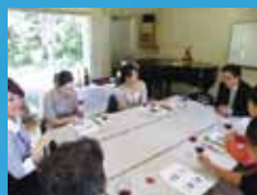
ワインの知識や歴史を学ぶとともに、ワインの美しい空け方から注ぎ方・頂き方を「できるまで」。